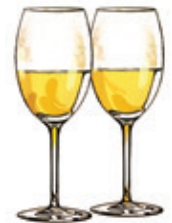
Deux verres de cidre 140 ml/5 oz 6% alc./vol.